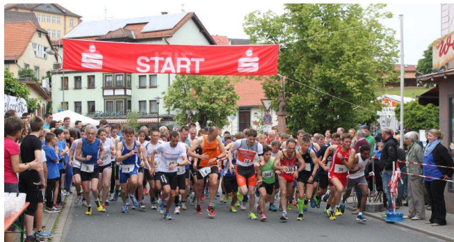
Beerfelder Stadtlauf 2014

Wilhelm-Hering-Gedächtnis-Lauf Samstagnachmittag den 10.10.2015 um 15:00 Uhr